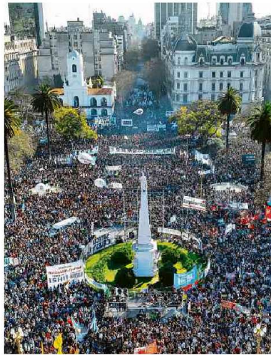
Milhares se reúnem em Buenos Aires

Simone Tebet é a 1ª dos presidencialáveis a responder a questões de crianças