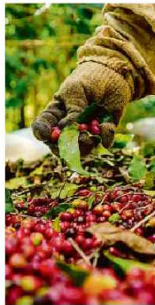
Grãos especiais em Patrocínio (MG)

Comida C8 Cafés raros têm preços de três dígitos e são vendidos fora dos supermercados